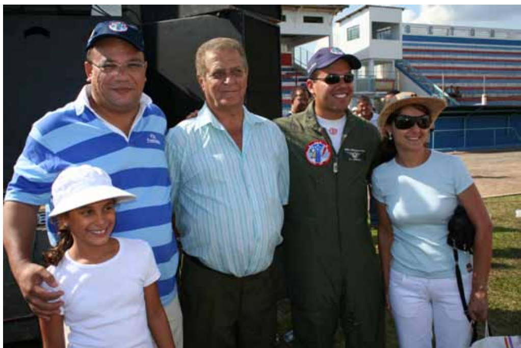
Público em demonstração de Penápolis/SP junto ao locutor, Ten Av Márcio

Na passagem do Dia do Aviador e da Força Aérea Brasileira, quero externar toda minha admiração pelo Esquadrão e seus bravos integrantes - pilotos, anjos da guarda e toda equipe que faz a retaguarda para que as apresentações sejam sempre cheias de emoção e destreza.