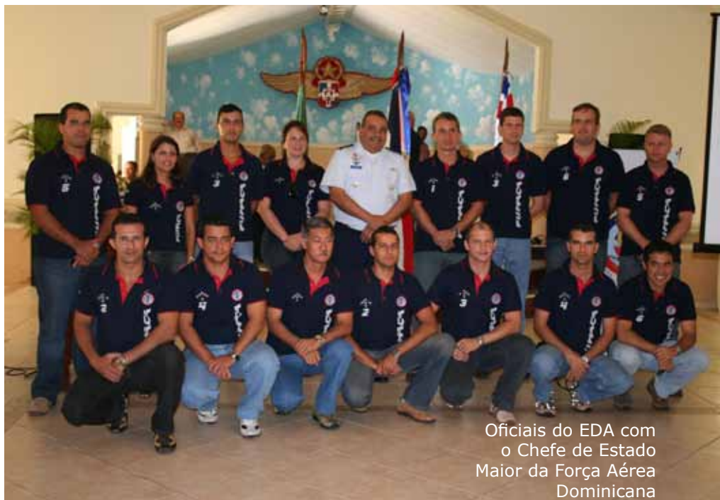
Oficiais do EDA com o Chefe de Estado Maior da Força Aérea Dominicana

Nos demais dias que o grupo permaneceu no país, percebeu-se a admiração estrangeira, tanto dominicana quanto de turistas, pelo Esquadrão que ostenta o título de “Embaixador do Brasil nos céus”. Seja no comércio local, nos eventos oficiais ou no hotel em que ficou hospedado, o grupo foi, por diversas vezes, abordado por pessoas que queriam parabenizá-lo pelo trabalho desenvolvido. Destacou-se um senhor que fez questão de frisar com seu espanhol lento para se fazer bem entender: “Deslumbrante! Foi o que vocês fizeram. O governo de seu país deve estar orgulhoso de vocês.”