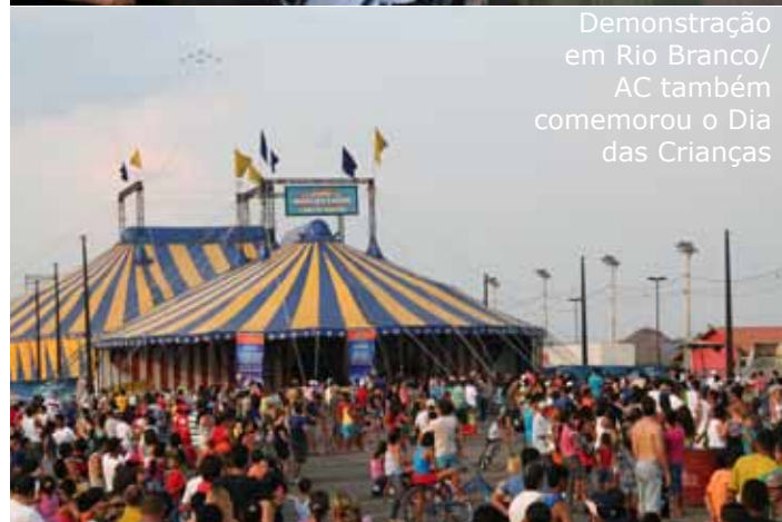
Demonstração em Rio Branco/AC também comemorou o Dia das Crianças