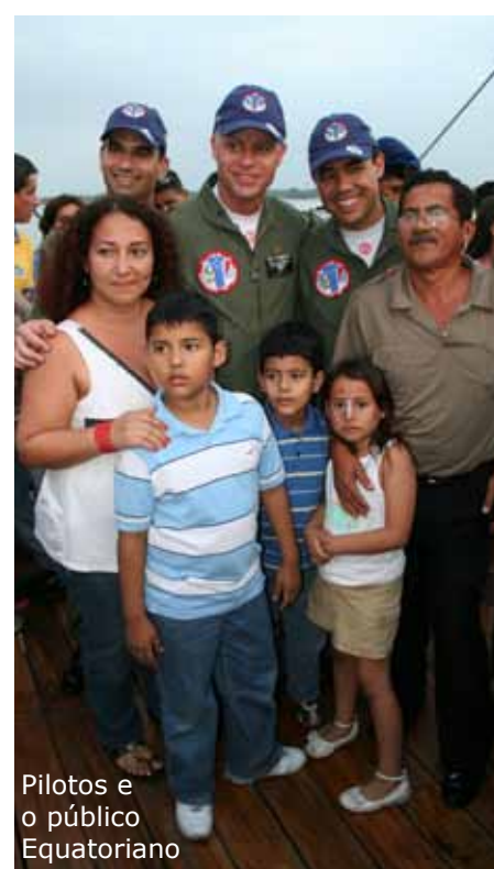
Pilotos e o público Equatoriano