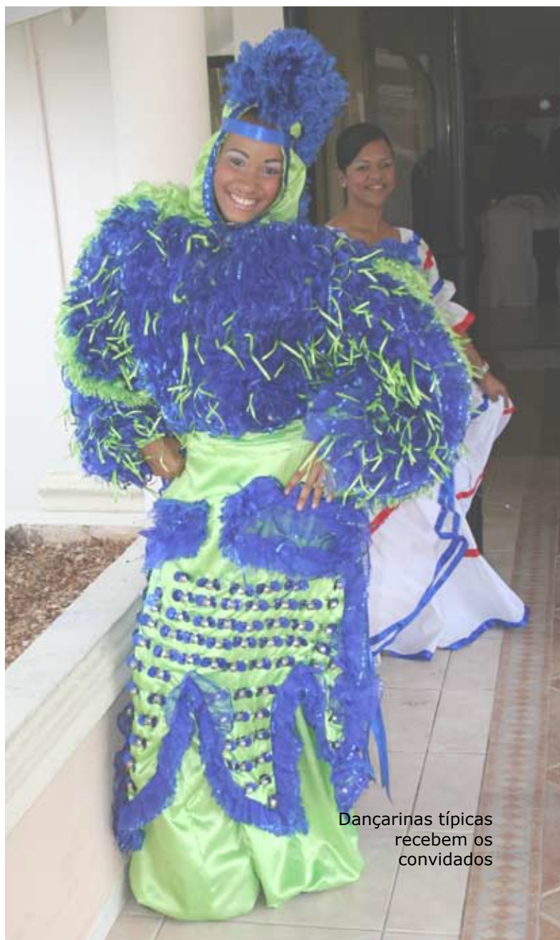
Dançarinas típicas recebem os convidados