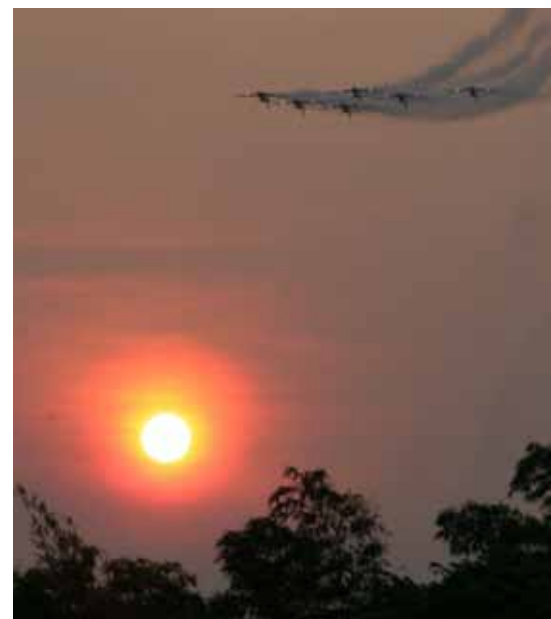
Pôr do sol emoldura "Dorsão", Manaus/AM

expressões verbais e faciais deixaram claro o quanto as manobras foram apreciadas. O ponto alto da performance foi a escrita com fumaça "Carifesta X – Guayana".