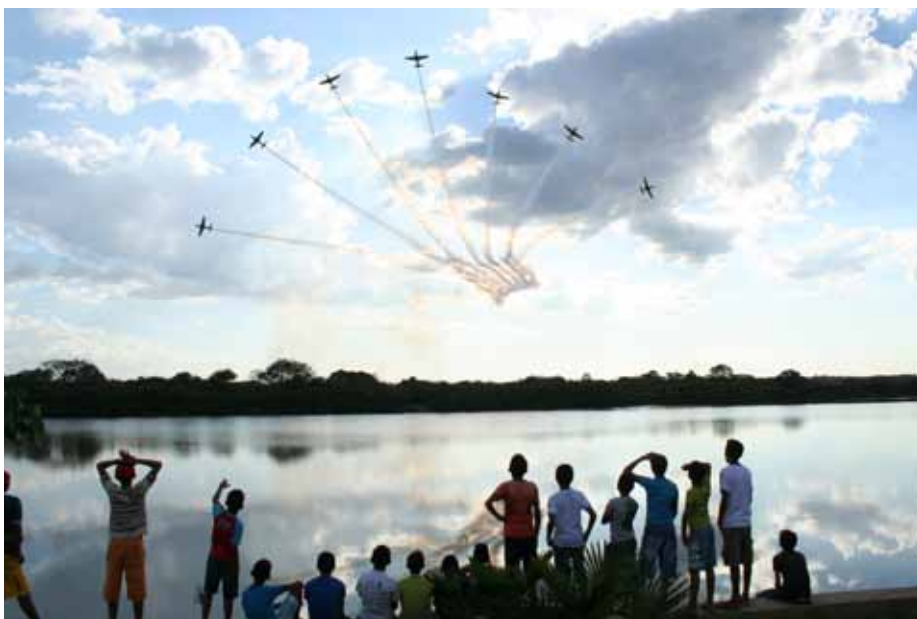
"Break" em Barras do Piauí/PI paralisa o público presente