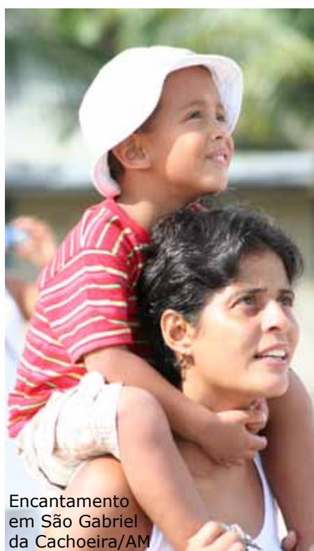
Encantamento em São Gabriel da Cachoeira/AM

Na tarde de 05 de outubro, dentre outras atrações aéreas, a Esquadrilha da Fumaça, anunciada pela organização como o