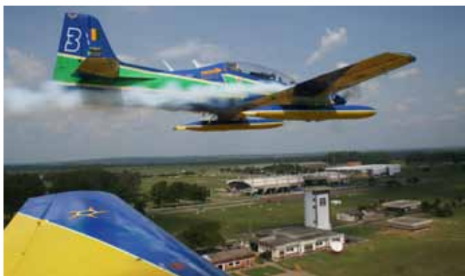
EDA saúda Pirassununga/SP com fumaça