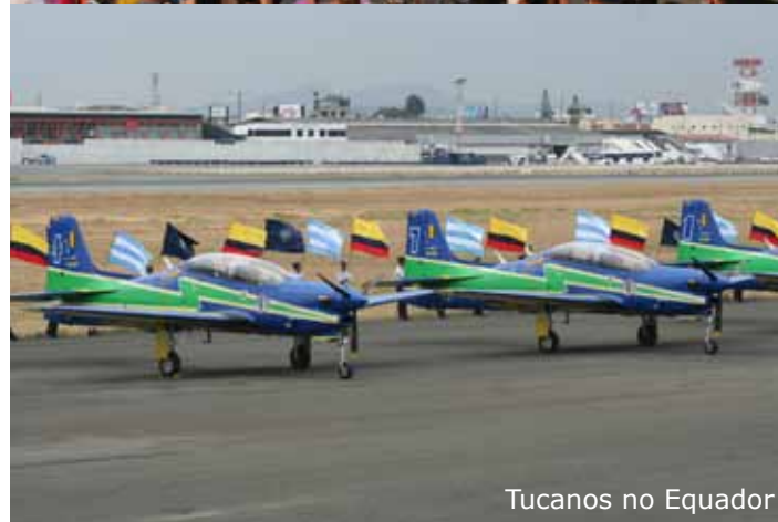
Tucanos no Equador