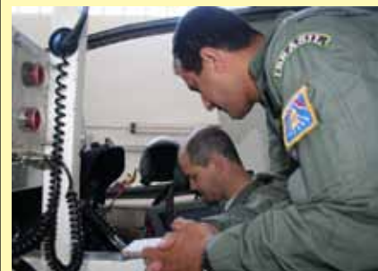
Pilotos no Simulador do T-27

O treinamento de panes críticas como, por exemplo, falha do motor em voo, falha elétrica total, fogo no motor em voo, ejeção, dentre outras, aperfeiçoa a agilidade dos pilotos em percebê-las e efetivar a ação corretiva nessas situações de emergência.