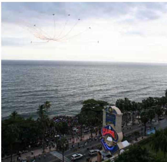
Break, a manobra mais apreciada pelos dominicanos