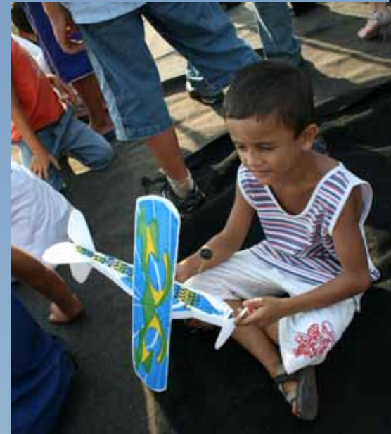
Criança distrai-se com avião, Araguaína/TO

As quase duzentas horas de voo foram capazes de promover a Força Aérea Brasileira como uma instituição formada por profissionais altamente qualificados e motivados. O Circuito Centro-Oeste Nordeste atingiu seu objetivo de despertar