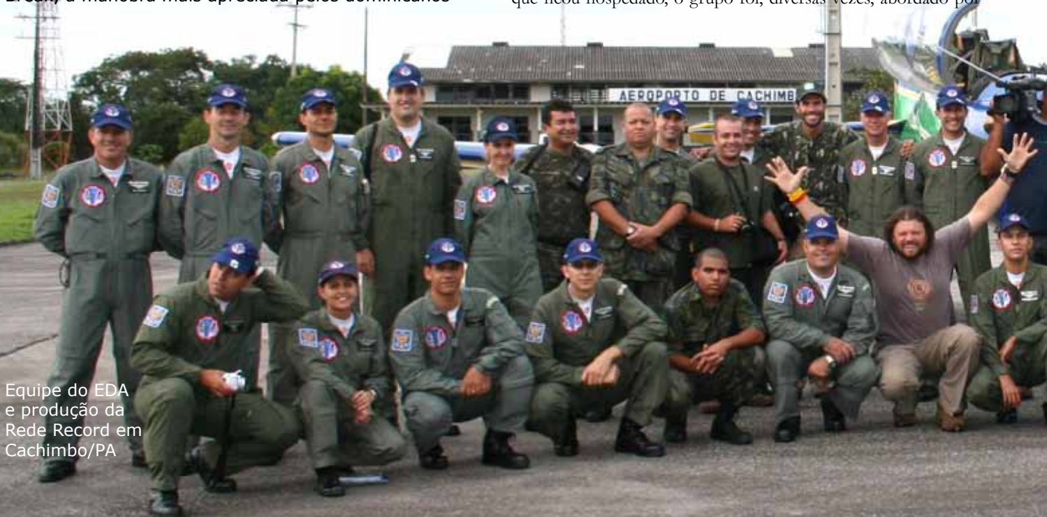
Equipe do EDA e produção da Rede Record em Cachimbo/PA

O Esquadrão de Demonstração Aérea inicia suas atividades do ano de 2009 com missão ao exterior. Antes, entretanto, atendendo às normas de segurança de voo, os pilotos concluíram sua readaptação ao voo acrobático, bem como treinaram o display de demonstração a ser apresentado no evento internacional.