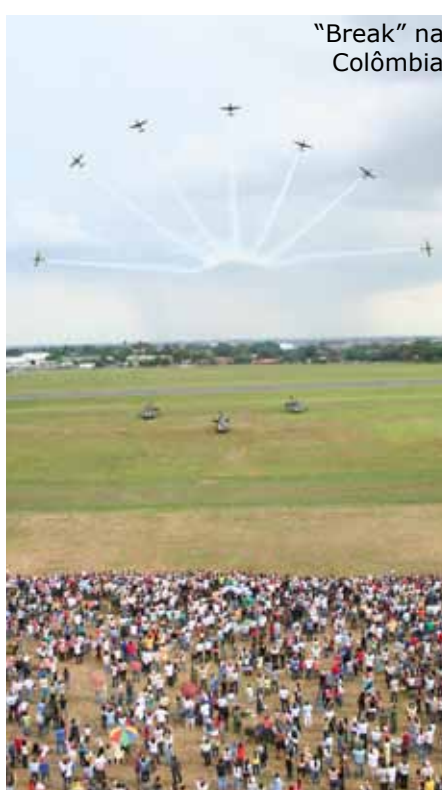
“Break” na Colômbia