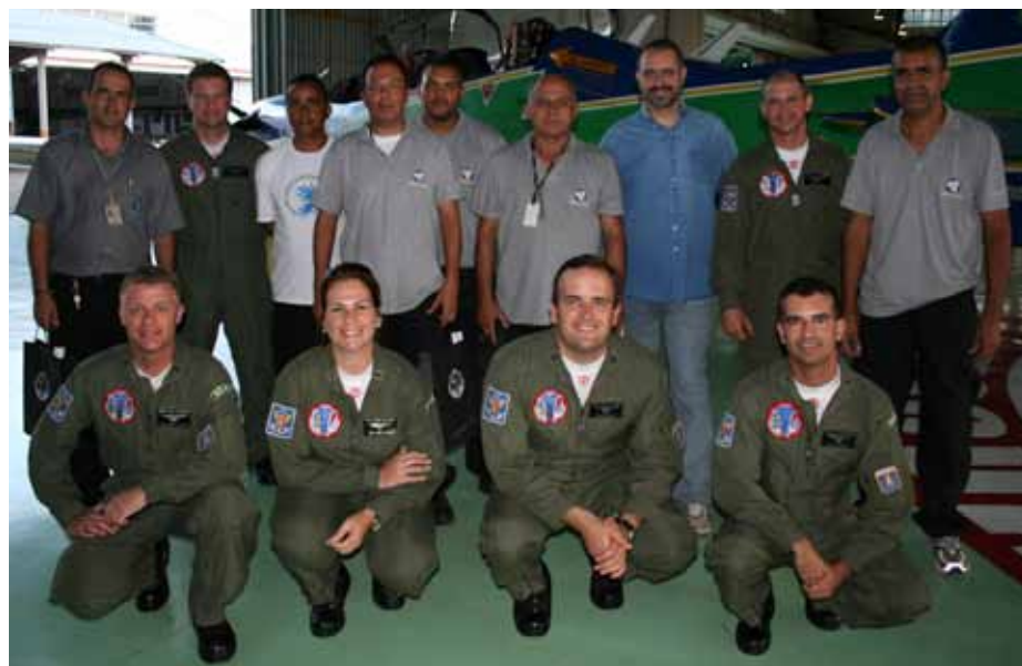
Equipe de produção do Programa e oficiais da Esquadrilha da Fumaça

Além disso, microcâmeras foram instaladas nas aeronaves durante demonstrações realizadas no interior paulista, o que rendeu belas imagens.