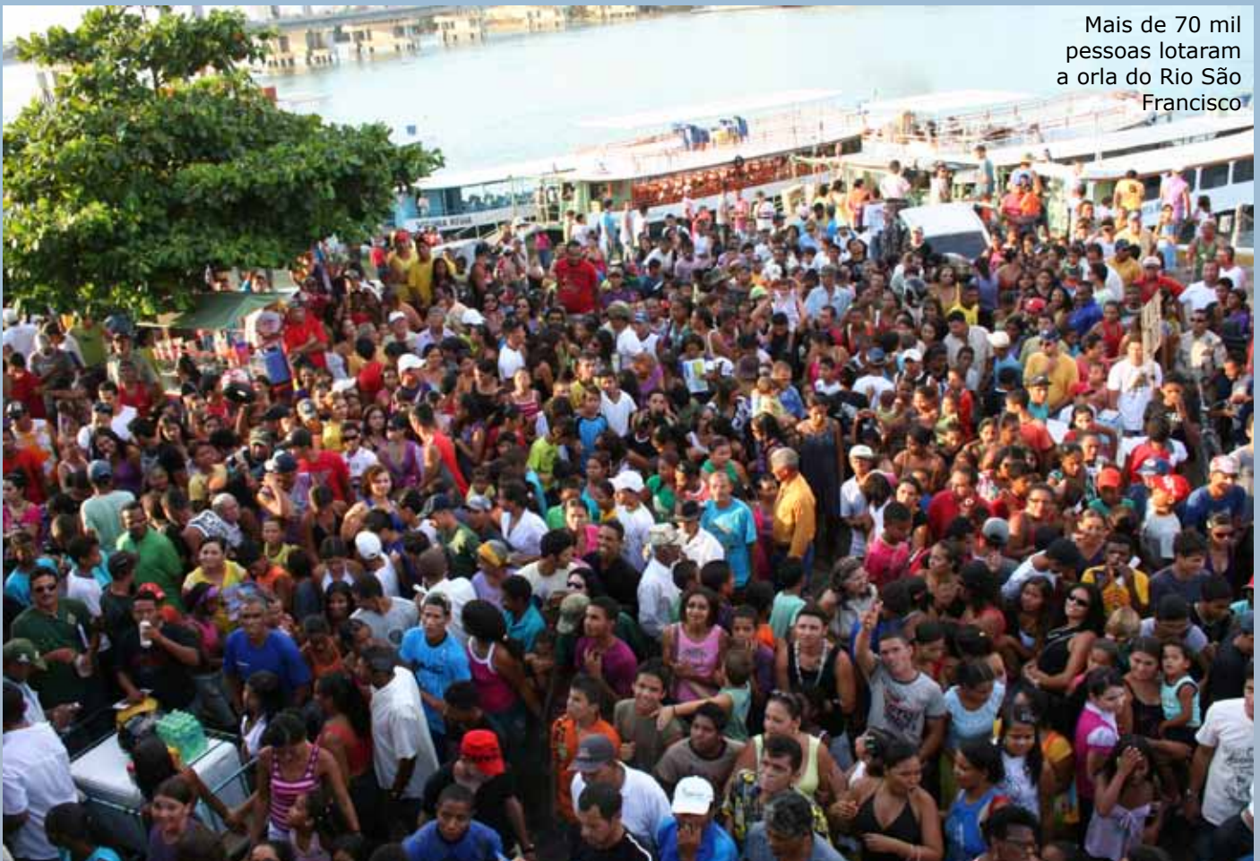
Mais de 70 mil pessoas lotaram a orla do Rio São Francisco

No dia 10 de novembro, após duas escalas técnicas para abastecimento, a Esquadrilha da Fumaça regressou ao lar, com mais uma missão bem cumprida.