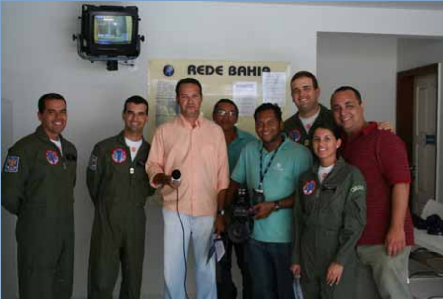
Oficiais foram aos estúdios da TV Globo para divulgar demonstrações

mil pessoas concentraram-se na Praia de Iracema para assistir às manobras e acrobacias desenhadas com objetivo de promover o encerramento da Semana da Asa da Base Aérea de Fortaleza. O público presente aplaudiu espontaneamente algumas manobras como, por exemplo, o Coração, muito bem desenhado no céu cearense.