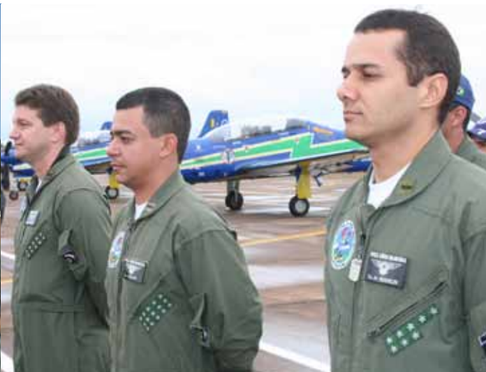
Novos integrantes entram em forma junto à equipe antiga