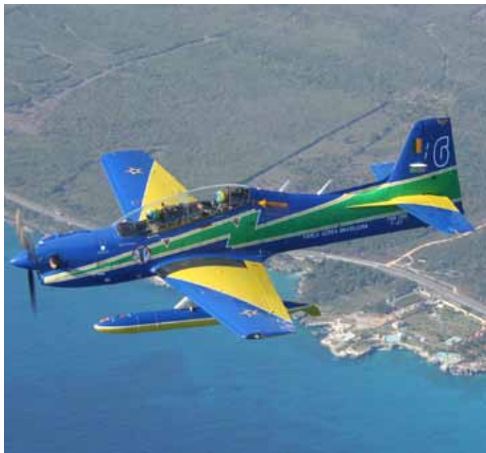
Chegada em Santo Domingo, T-27 sobrevoa Mar do Caribe

Ao final da missão, foram computadas aproximadamente 288 horas voadas, sendo 281 horas de deslocamento e 7 horas de demonstração, um público de 350 mil pessoas, envolvimento de 42 militares, oito aeronaves T-27 Tucano e uma aeronave C-130 Hércules.