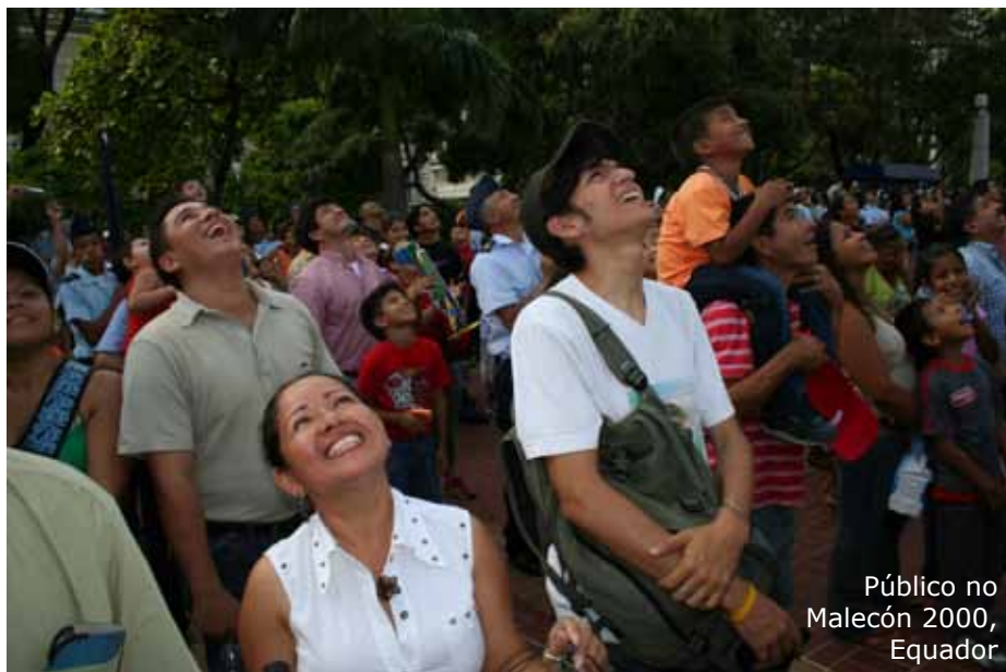
Público no Malecón 2000, Equador

Olhos atentos, suspiros e salva de palmas, foi o cenário propiciado pelo Esquadrão Social da Força Aérea Brasileira.