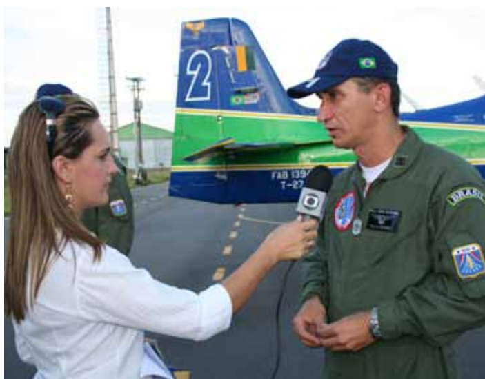
Cmt do EDA cede entrevista no retorno ao Brasil