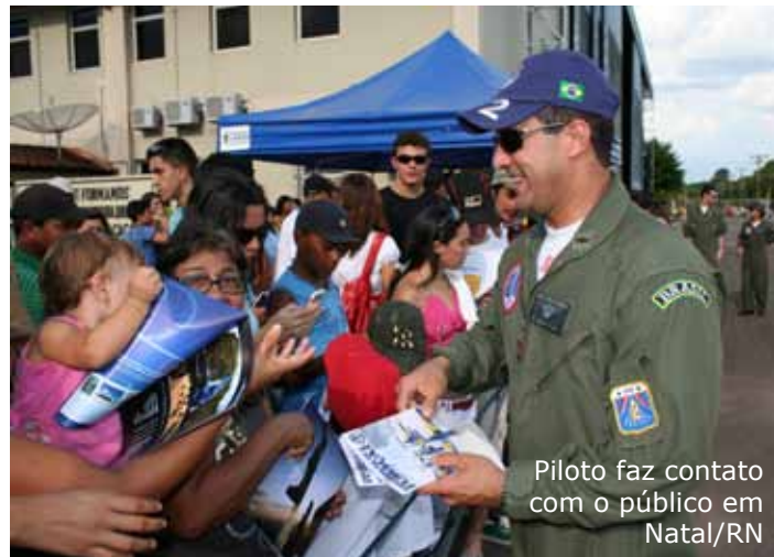
Piloto faz contato com o público em Natal/RN

Confira alguns números desta missão: - Cinco demonstrações realizadas, sendo duas internacionais; - Mais de 250 horas voadas; - Quase 200 mil expectadores diretos; - Oito aeronaves T-27 Tucanos, apoiadas por uma aeronave C-130 Hércules; e - Quarenta e quatro militares