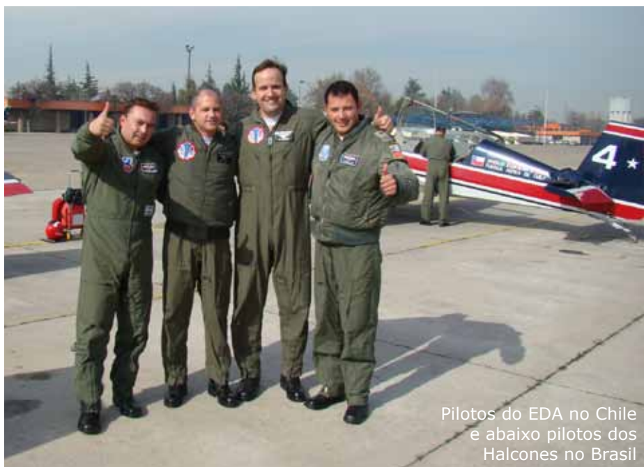
Pilotos do EDA no Chile e abaixo pilotos dos Halcones no Brasil

sociais, culturais, turísticos e operacionais. Os pilotos chilenos também tiveram oportunidade de conhecer as cidades do Rio de Janeiro/RJ, São Paulo/SP e Ribeirão Preto/SP.