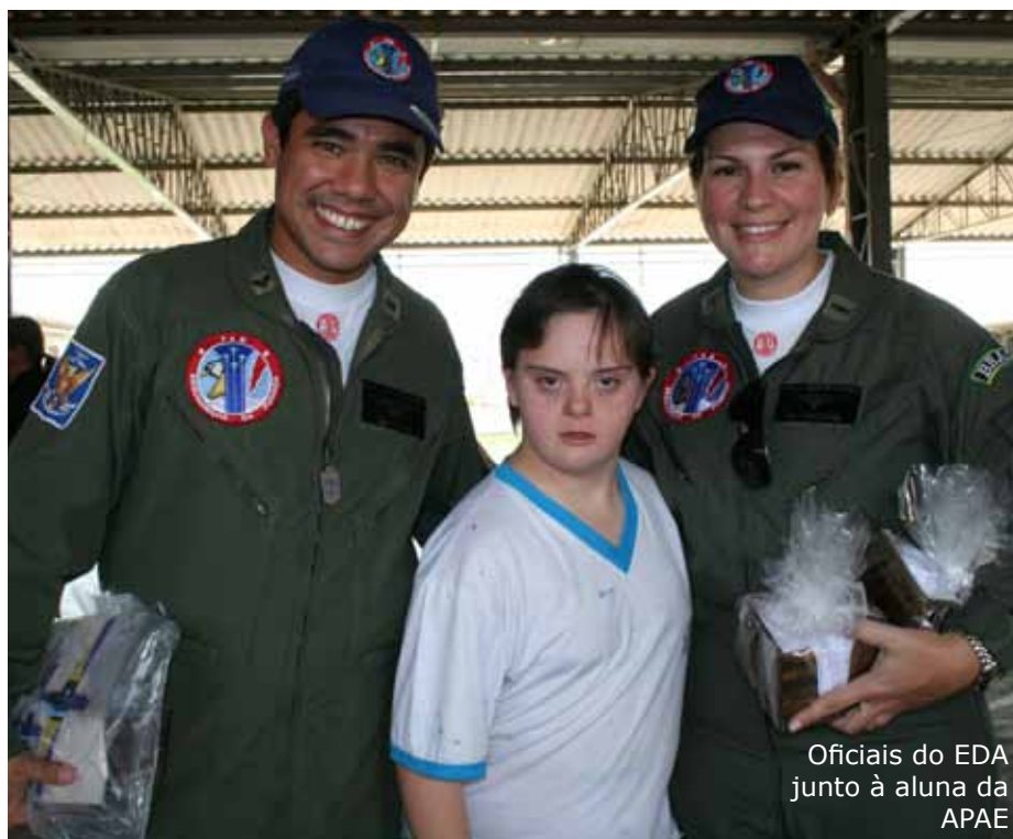
Oficiais do EDA junto à aluna da APAE