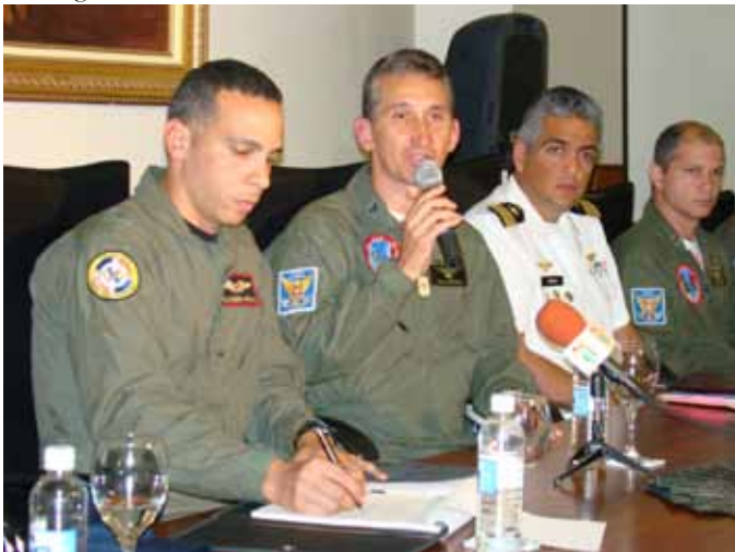
Pilotos participam de coletiva de imprensa

No dia 28, recepcionada pelo Chefe do Estado Maior da Força Aérea da República Dominicana, Exmo Sr Major General Piloto Carlos R. M Altuna Tezanos, a equipe participou de um almoço. Além de conhecer as comidas típicas do país, a equipe também apreciou um show artístico com as danças locais: perico ripiao, merengue e bachata.