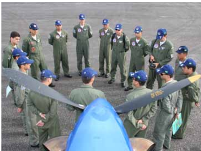
Briefing dos pilotos antes da decolagem, Cachimbo/PA