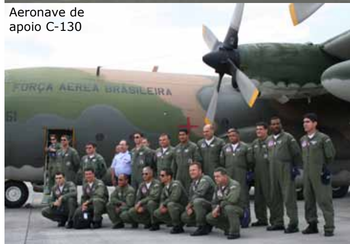
Aeronave de apoio C-130